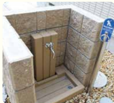
ペット足洗い場(共有部)