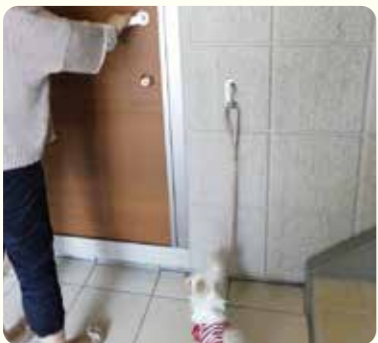
リードフック(住戸内)

ワンちゃんとの快適生活のポイントとなる設備を、共有スペースと住戸スペースにプラスしました。ポケットパークは、飼い主同士、ワンちゃん同士の楽しい交流スペースにもなります。*写真はイメージです