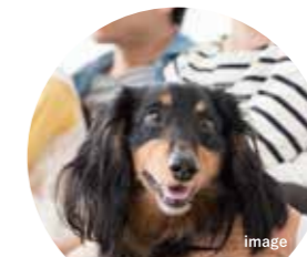
交流イベント企画