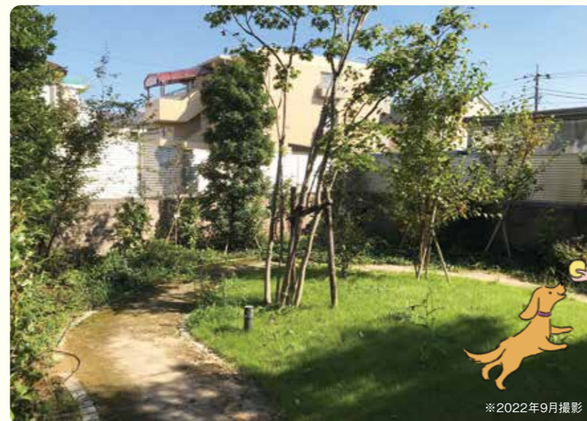
ポケットパーク(共有部)