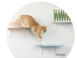
ペットアイテム提案